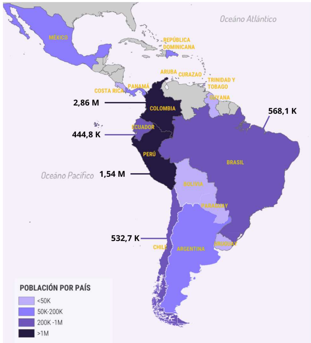
Figura 1. Distribución de población venezolana residente en países de América del Sur